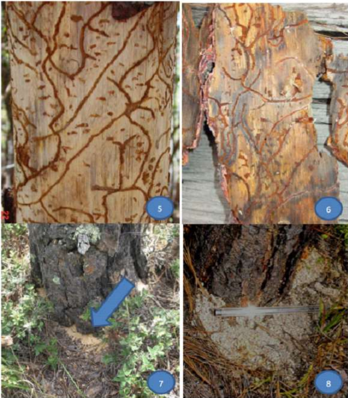
Fotografía 5.- Galerías por descortezadores en la zona del cámbium. 6.- Corteza desprendida, sobre su interior también se aprecian las galerías. Fotografías 7 y 8.- Sobre la base del fuste del arbolado infestado, se aprecian gránulos de resina cristalizada.